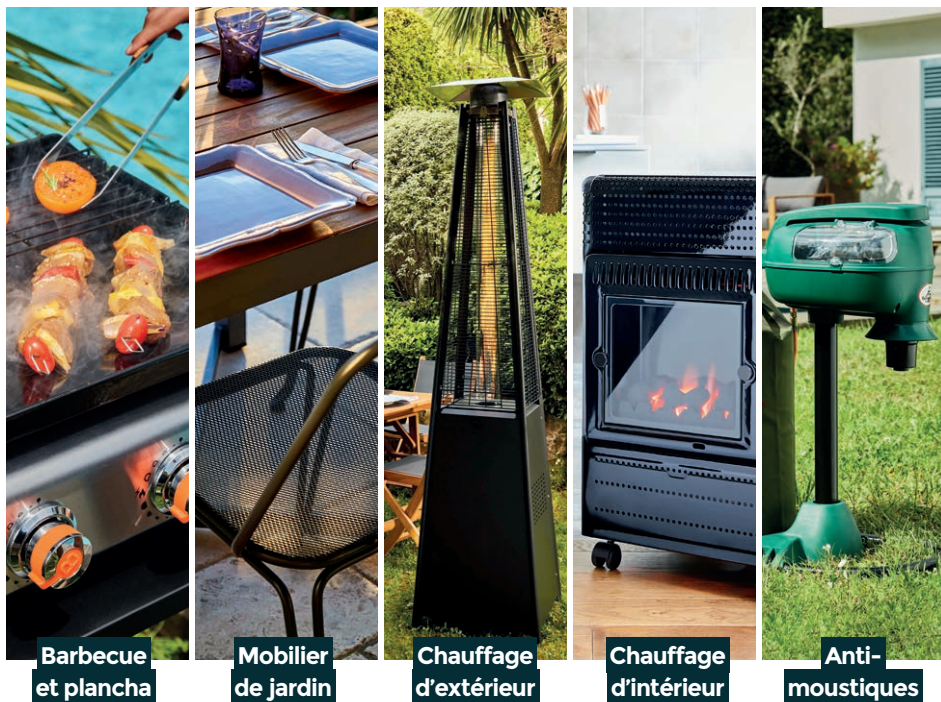
Barbecue et plancha

Véritable référence du confort et du loisir outdoor, Favex réunit tous les équipements indispensables de la maison au jardin. Du parasol chauffant à l'anti-moustiques en passant par le barbecue ou la plancha, depuis plus de 40 ans les univers Favex invitent au partage et à la détente pour transformer le quotidien.